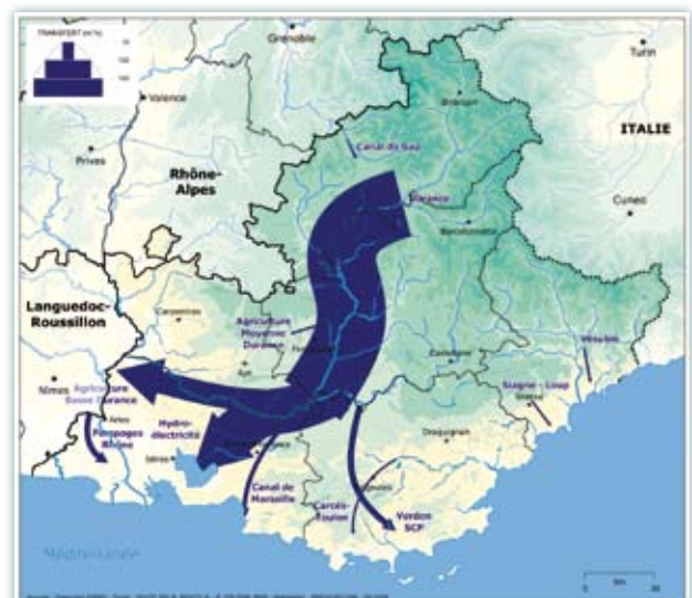
Une réponse historique, les transferts d'eau...